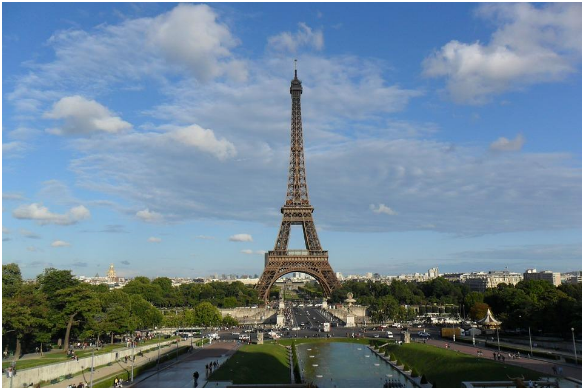
エッフェル塔（とう）がきれいなパリ

ねんしちがつじゅうよっ か ひとびと かくめい お 1789年7月14日、パリの人々が、「革命」を起こしまし かくめい しゃかい か こうどう た。「革命」は、社会を変えるための行動です。