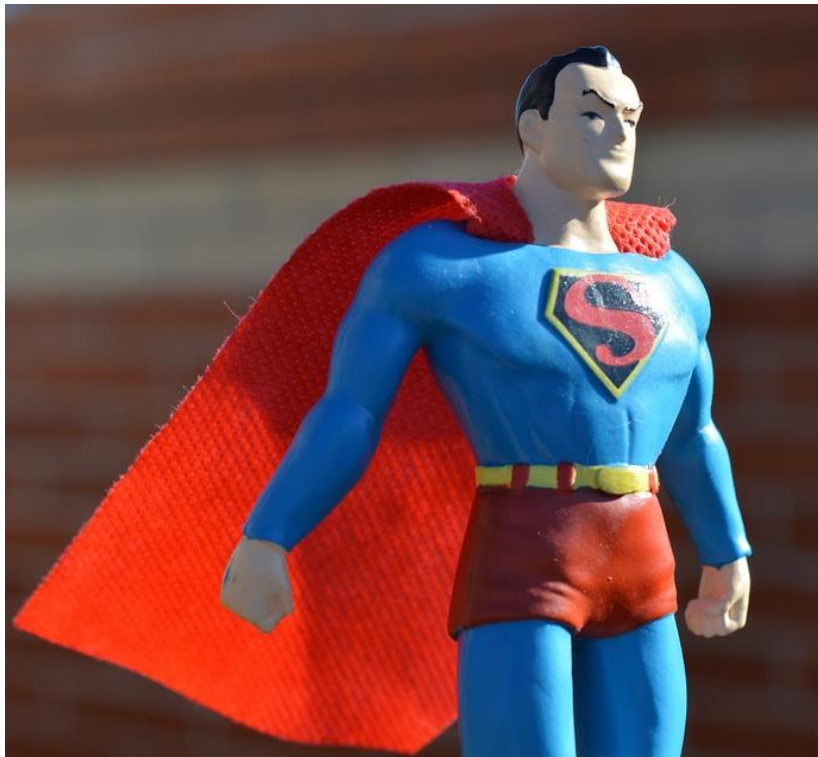
スーパーマン