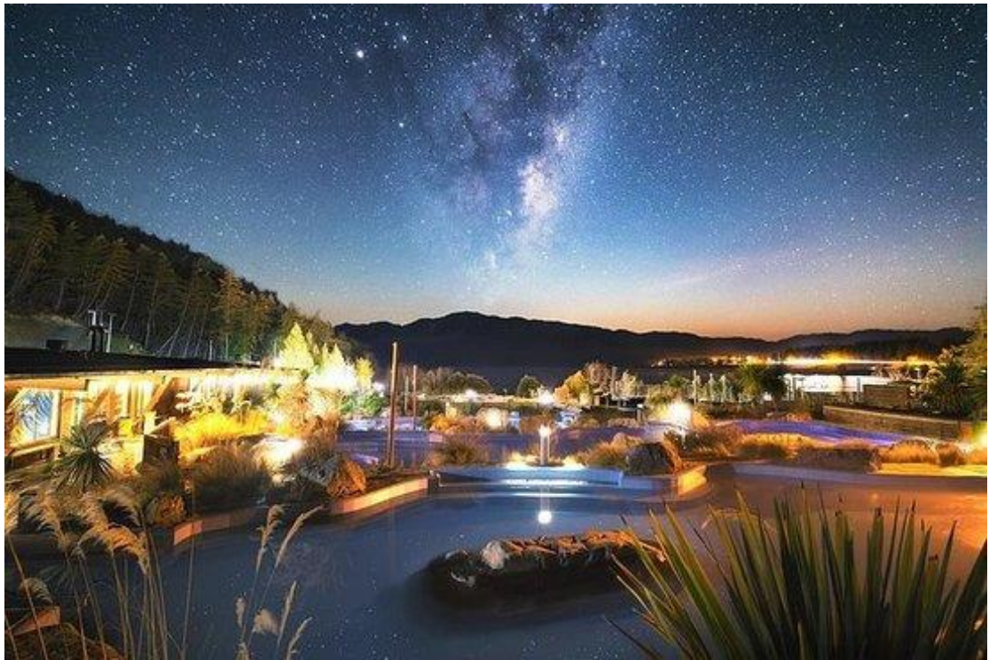
テカポの ほしぞら 星空