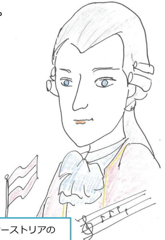
オーストリアの モーツァルト