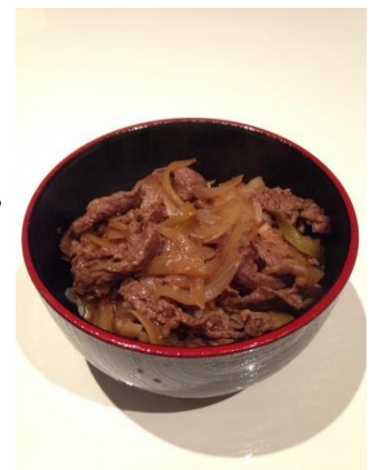
ぎゅうどん ぎゅうにく うえ どんぶり 牛丼：牛肉をごはんの上にのせた丼

どんぶり がいこくじん にんき 「丼」も「ビビンバ」も、外国人にとっても人気があります。